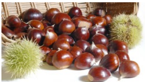
Esskastanien: Einst ein wichtiges Nahrungsmittel

Nicht nur der Platanenkrebs wurde aus Amerika eingeschleppt, auch eine Krankheit, "die alleine in Nordamerika 3,5 Milliarden Esskastanien umgebracht hat" , so Niesar: der Kastanienrindenkrebs, verursacht von einem Pilz. Die Maronenbäume liefern nicht nur wertvolles Holz. Ihre Früchte waren auch ein wichtiges Nahrungsmittel, etwa in der Pfalz, im Süden der Alpen und in den französischen Cevennen. In den 1950-er Jahren richtete der Kastanienrindenkrebs hier große Schäden an. Dann geschah etwas Merkwürdiges: Der Krankheitserreger wurde seinerseits von Viren befallen, "die dann die krankmachende Wirkung dieses Pilzes herab gesetzt haben" , berichtet Niesar